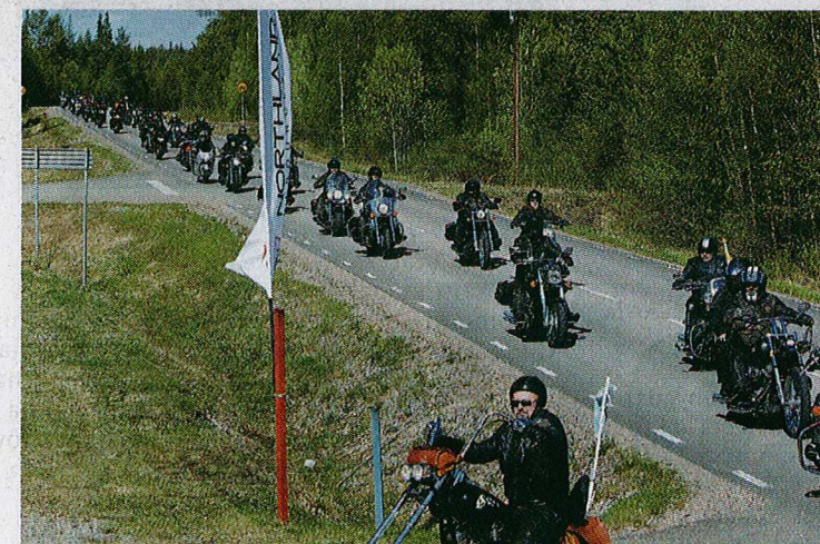
Cirka 120 motorcyklar deltog i Pingstrundan som pågick i två dagar i Sverige och Finland.

Intresset för Pingstrundan har ständigt ökat sen starten år 2006. I år kördes rundan i strålände väder, soligt och varm båda dagarna. Årets Pingstrunda gick längs en förändrad sträckning och under två dagar i år. Starten skedde i Pajala vid Malmen där kulturskolan underhöll med "mc-vänlig" musik, sedan fikastopp i Junosuando, en vildmarkslunch vid fiskecampen Naakajärvi och slutligen avslutades