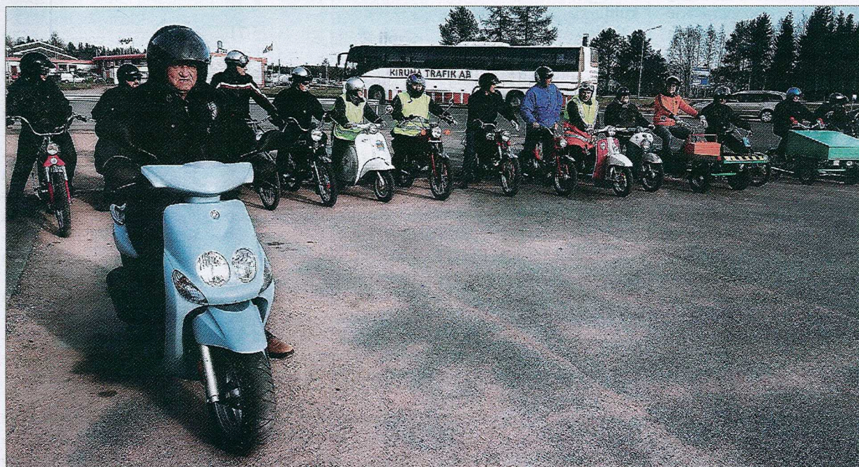
Mopotapahtumassa oli niin uusia kuin vanhojakin mopoja.