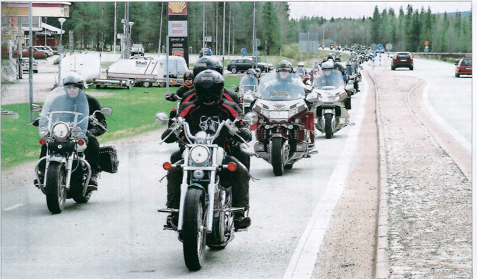
Moottoripyöräjono oli kuin Pajalan taajama-alueen läpi kulkenut helminauha.