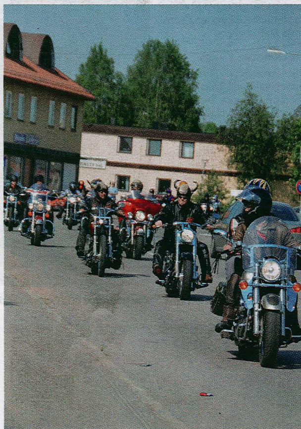
En svalkande motorcykeltur är nte helt fel i högsommarväder. De drygt hundra åkarna är på väg att lämna Pajala.