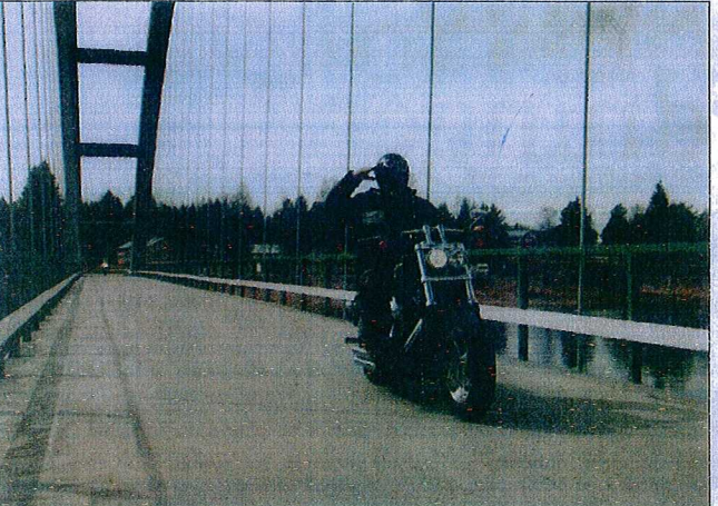
Pingstrundan har nått Tarendö med ett muller som skrämmer allt vilt på flykt.