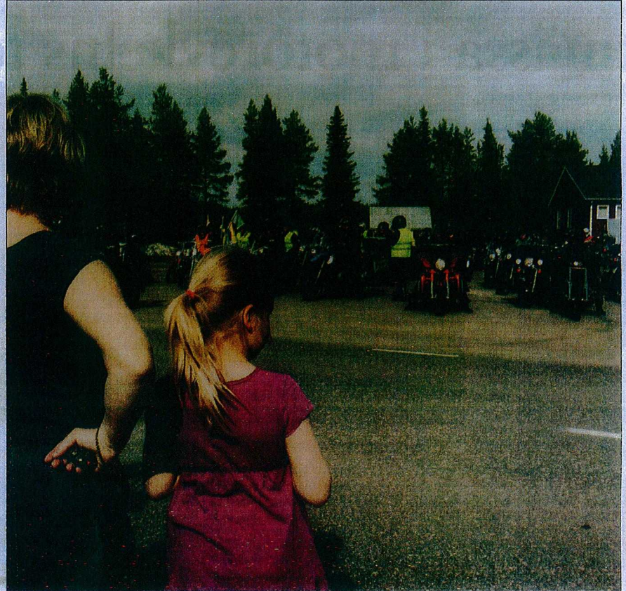
Tarendöbor samlades för att se kortegens utåg ur Tarendö.